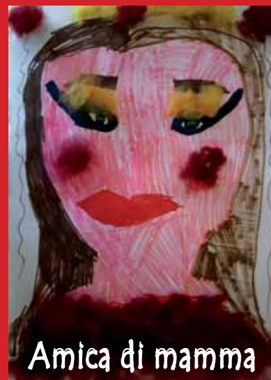
Amica di mamma